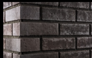
Das fertige Fugenbild. Es werden immer vollständige Seiten ausgefugt.