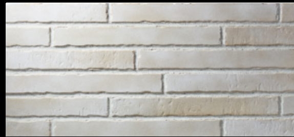
Glanzstück № 4 Δ < 6 % · DIN EN 14411, Gr. A II - Teil 1