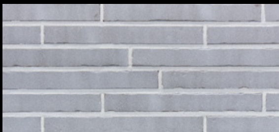
Glanzstück № 7 Δ < 3 % · DIN EN 14411, Gr. A b