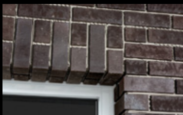
Ein perfekt mit Winkeln nachgebildeter Fenstersturz.

Verfugung: Nach dem Verarbeiten der Klinkerriemchen kann nach entsprechender Standzeit (Angaben des Mörtelherstellers beachten) mit dem Ausfugen begonnen werden. Klinkerriemchen mit glatten Oberflächen können im Schlämmverfahren verarbeitet werden. Der Markt verfügt über eine Vielzahl an Fugenmörteln, einigen sind jedoch Kunststoffe und Farbpigmente zugesetzt. Deshalb sollte vor Auswahl des Fugenmörtels unbedingt Rücksprache mit dem Mörtelhersteller bezüglich der Eignung gehalten werden. Alle rauen, patinierten und strukturierten Oberflächen werden konventionell mit Fugeisen und Fugblech ausgefugt.