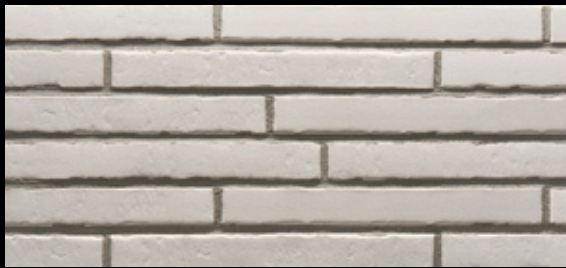
Glanzstück № 3 Δ < 6 % · DIN EN 14411, Gr. A II - Teil 1