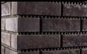
Die fertig verlegte Fläche. Nach Standzeit kann mit dem Ausfugen begonnen werden.