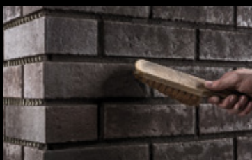
Das Abkehren der Fuge verleiht dieser eine entsprechende Struktur.