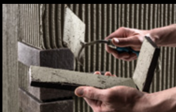
Die Eckwinkel werden im Floating-Buttering-Verfahren verarbeitet.