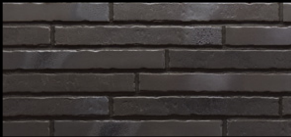
Glanzstück № 1 Δ < 3 % · DIN EN 14411, Gr. A b