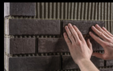
Das Setzen der Flächen-Klinkerriemchen mithilfe einer Schnur. Die Klinkerriemchen werden in das Klebett eingedrückt.