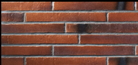
Glanzstück № 5 Δ < 6 % · DIN EN 14411, Gr. A II - Teil 1