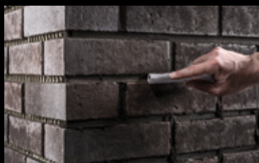
Mit der Kellenverfugung können verschiedene Optiken herausgearbeitet werden.