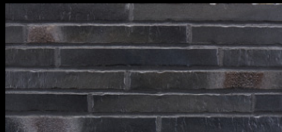
Glanzstück № 6 Δ < 3 % · DIN EN 14411, Gr. A b