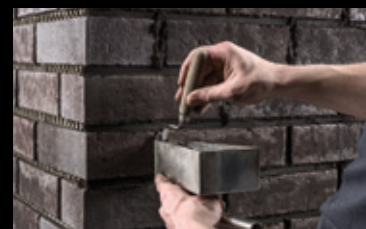
Die vertikalen Fugen lassen sich mit einem kleineren Fugeisen einfacher ausführen.