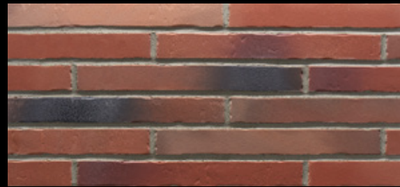
Glanzstück № 2 Δ < 3 % · DIN EN 14411, Gr. A b